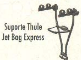
Suporte Thule Jet Bag Express

Av. Pres. Vargas, 1083 (16) 3623 6100 R. Minas c/ Av. Saudade (16) 3636 1486 www.bikecenterribeirao.com.br Ribeirão Preto - SP