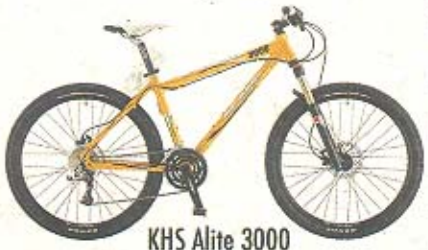
KHS Alite 3000