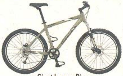
Giant Iguana Disc