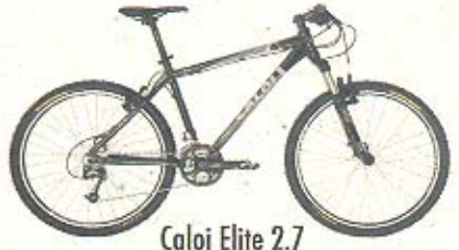
Caloi Elite 2.7