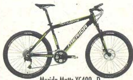
Merida Matts XC400 - D