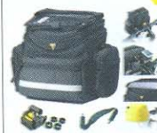
BOLSA DE GUIDAO TOPEAK TOURGUIDE HANDLEBAR BAG R$ 299,90

COMPLETA LINHA DE PEÇAS, ACESSÓRIOS E VESTUÁRIOS DAS MELHORES MARCAS