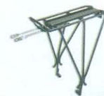
BAGAGEIRO TOPEAK EXPLORER TUBULAR RACK (P/ BIKES C/ FREIO A DISCO) R$ 196,90