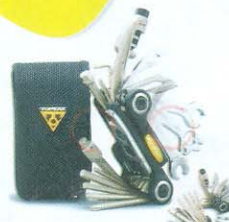
FERRAMENTA TOPEAK ALIEN II (26 FUNÇÕES) R$ 199,90