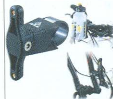
ADAPTADOR DE SUPORTE DE CARAMANHOLA TOPEAK CAGE MONT R$ 29,90