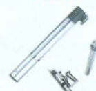
BOMBA DE QUADRO TOPEAK MASTER BLASTER R$ 149,90