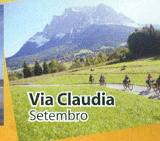
Via Claudia Setembro