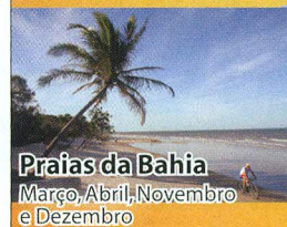
Praias da Bahia Março, Abril, Novembro e Dezembro

Mais de 100 roteiros no Brasil e Exterior