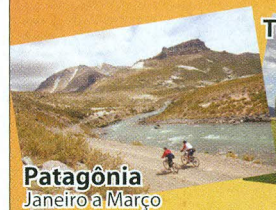
Patagônia Janeiro a Março

Mountain Bike, Ciclismo, Cicloturismo e Competição