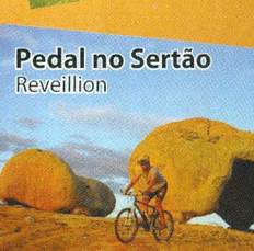
Pedal no Sertão Reveillion