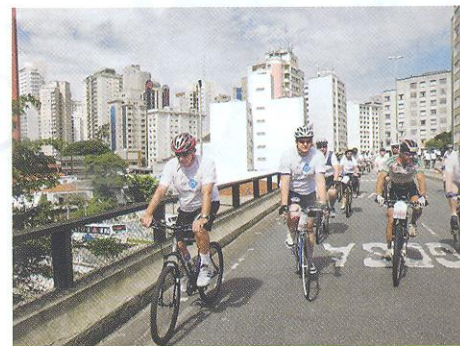
O uso da bicicleta como transporte alternativo é outra mensagem do passeio

"A partir de eventos periódicos caracterizados por passeios sem compromisso, com diversão, encontros de amigos e o contato direto com a natureza, conseguimos atrair um público cada vez maior para conhecer o que o centro de São Paulo tem de melhor em termos de cultura, entretenimento e lazer", ressalta Tarso. ☺