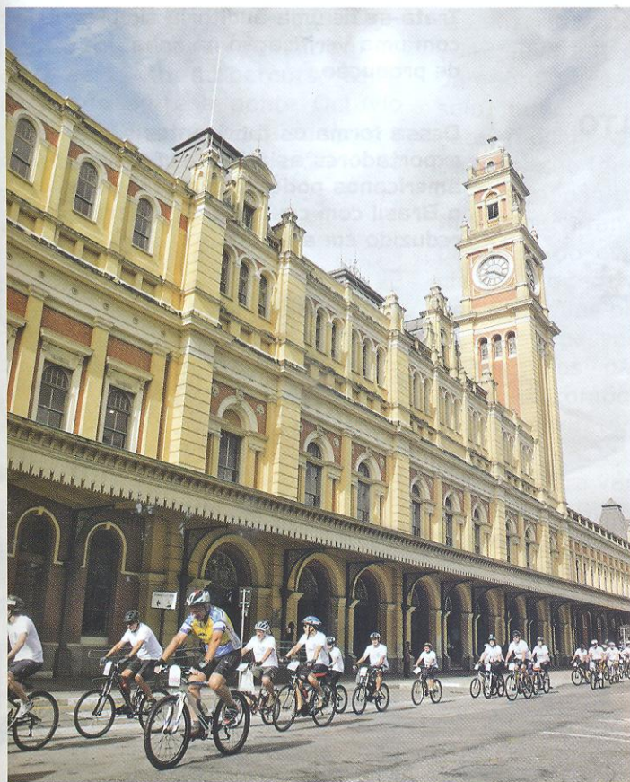
Propostas do SP Bike Tour é fazer com que os participantes conheçam a cidade de uma forma diferente. Destaque para a Estação da Luz