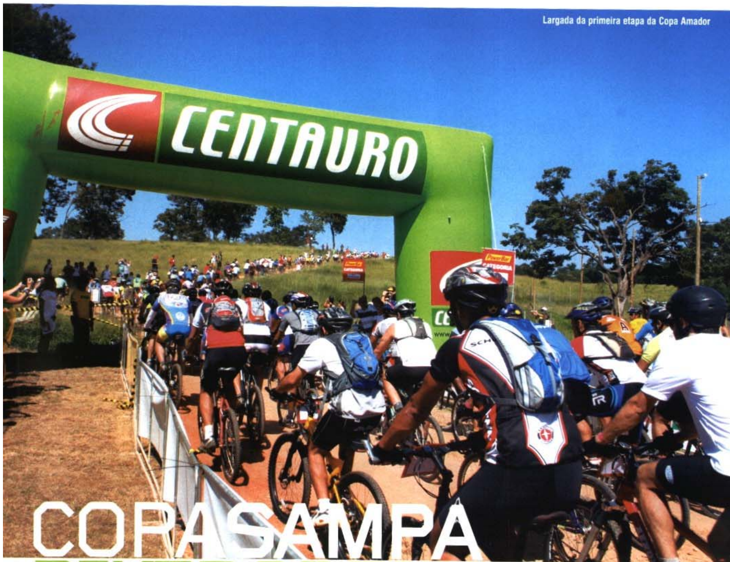
Largada da primeira etapa da Copa Amador